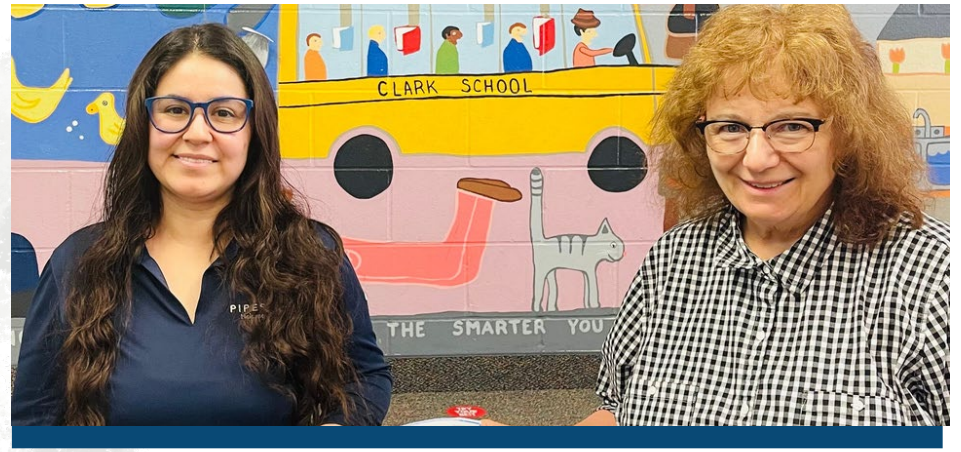
CLARK ELEMENTARY SCHOOL Sponsored on behalf of Husky