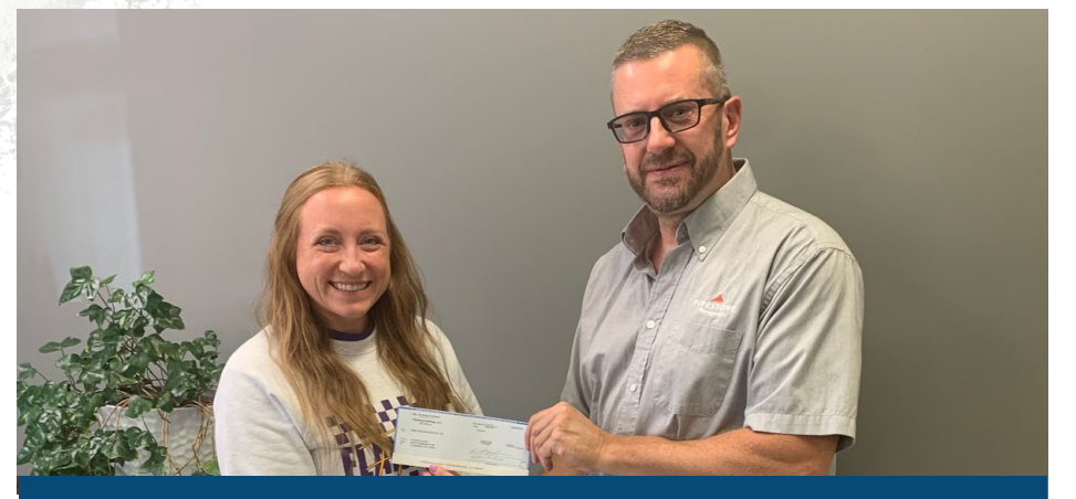
ESCUELAS DE LOS ALREDEDORES DEL CONDADO DE GRUNDY Patrocinadas en nombre de Jayhawk

La iniciativa se centra en hacer frente a la inseguridad alimentaria y suministrar artículos de primera necesidad a los niños que lo necesitan en sus comunidades.