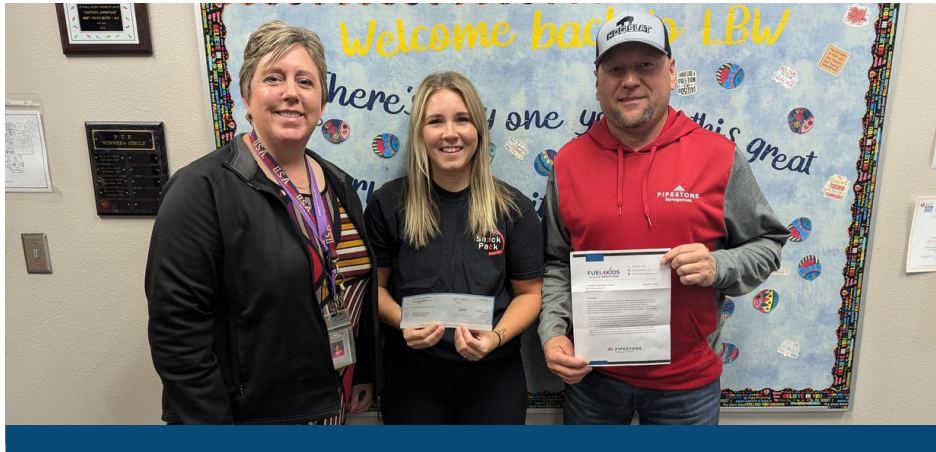
L.B. WILLIAMS ELEMENTARY SCHOOL Patrocinada en nombre de Bluestem