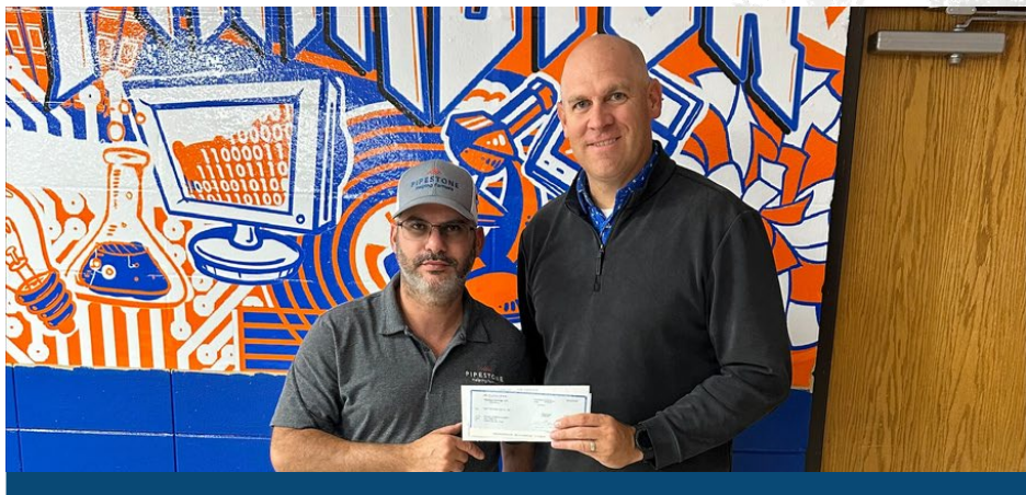
PARKSTON SCHOOL Patrocinada en nombre de Jackrabbit