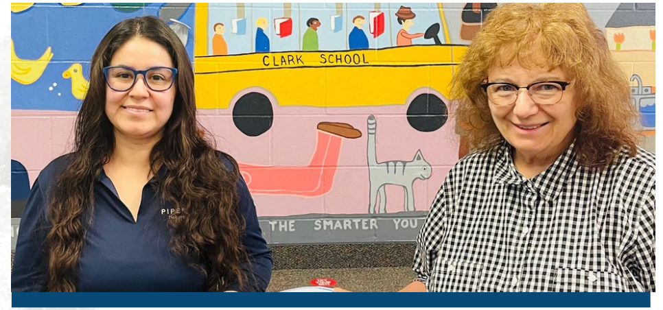
CLARK ELEMENTARY SCHOOL Patrocinada en nombre de Husky